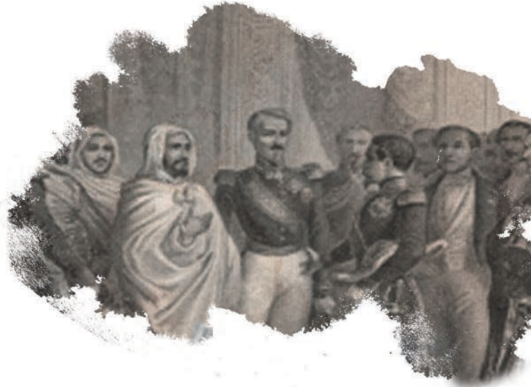
Emir Abdulkadir'in St-Claud'da Louis Napolyon tarafından kabulü