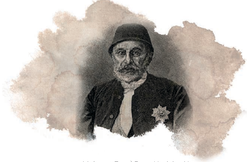
Mehmet Fuad Paşa Hariciye Nazırı

İkinci sürgün yeri olan Château de Pau'da, Emir Abdülkâdir bir vekil olan Comte de Falloux'yu, ayrıca Aralık 1848'de Başkan Louis Napoleon Bonaparte tarafından atanan Kamu