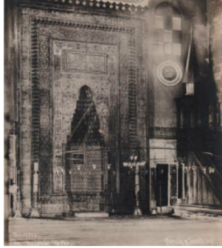
Bursa Yeşil Camii 34