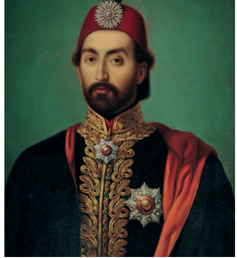
Abdülmecid Han (1. Abdülmecid)

Osmanlı siyasi sınıfının Emir Abdülkâdir'e gösterdiği coşku ve alakanın gerisinde kalmamak için, Fransa'nın İstanbul büyükelçisi Marquis de Lavalette, Emir'in onuruna büyük bir parti düzenledi ve İstanbul'da bulunan tüm diplomatik görevlileri, şehrin siyasi şahsiyetlerini ve eşrafını davet etti.