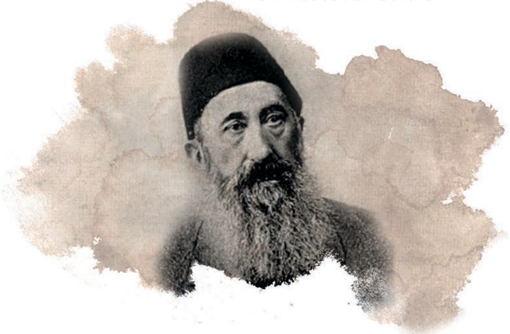
Arif Hikmet Bey

Osmanlı siyasi sınıfının Emir Abdülkâdir'e gösterdiği coşku ve alakanın gerisinde kalmamak için, Fransa'nın İstanbul büyükelçisi Marquis de Lavalette, Emir'in onuruna büyük bir parti düzenledi ve İstanbul'da bulunan tüm diplomatik görevlileri, şehrin siyasi şahsiyetlerini ve eşrafını davet etti.