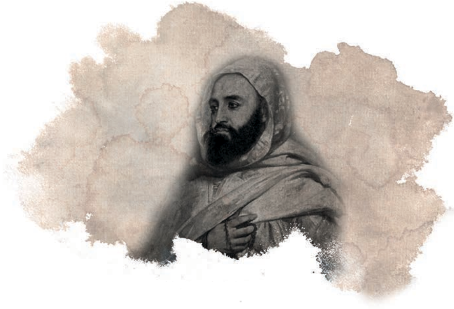
Emir Abdülkâdir (Jean-Baptiste Ange Tissier, 1852)