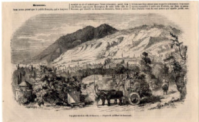
Gravür (1852). Bursa Şehri. Çelebi Mehmed - Yeşil Camii

Burada sanayinin gelişmiş olması, rekabet gücünü sağlayan en yeni makinelere sahip olmasından ileri gelmekteydi. Nitekim Bursa'daki ilk buharlı iplik işletmesi 1838 yılında faaliyete geçmiştir. Nicolas Vatin " bu tesislerin ilk başta yabancı, daha sonra da yerli sermaye ile çoğaldıklarını; 1852'de ise Devlet'e ait bir iplik fabrikası kurulduğunu" belirtir (Vatin N., s. 192, Cornec S., 2018)