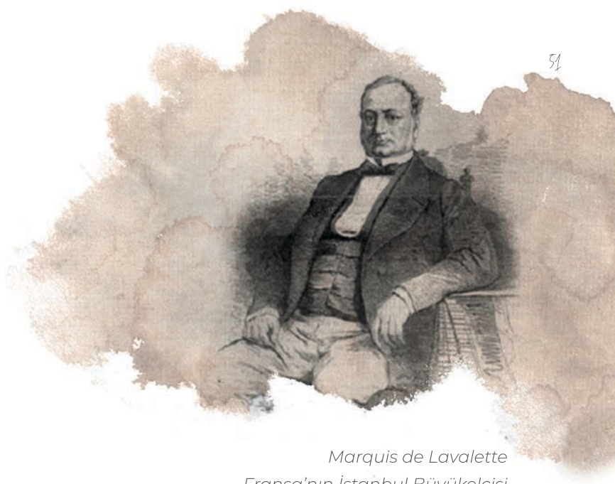
Marquis de Lavalette Fransa'nın İstanbul Büyükelçisi

“Ayrıca Fransız Hükümeti, Abdülkâdir’in Bursa’ya nakledilmesi ve eski servetine yakışır bir konuma gelmesi için gerekli adımları atacaktır.