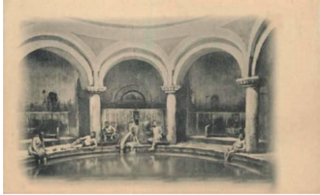
Bursa, Yeni Kaplıca, 1894

Şehir aynı zamanda kaplıcaları ve kükürtlü su depoları ile bir sular şehridir.