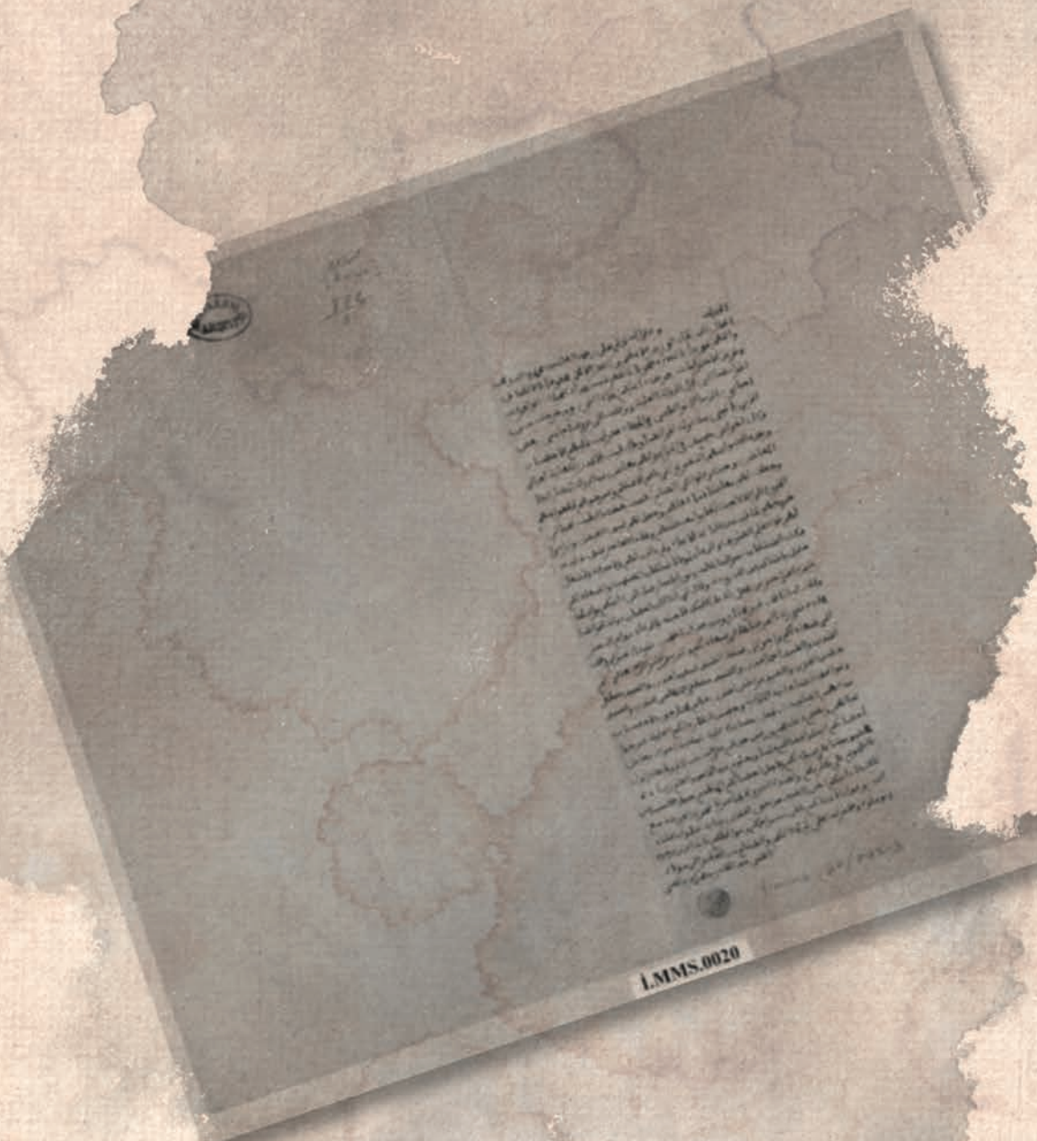
Ek 5: Emir'den Osmanlı Sadrazamına, bazı akrabaları için emekli ma- aşı talep eden mektup.