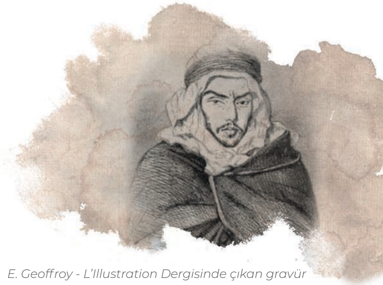
E. Geoffroy - L'illustration Dergisinde çıkan gravür (15 Mayıs 1847, n° 220)

Boumaza’yı Paris’e naklettiler. Yaşını göz önünde bulundurarak, Fransızlar ondan yararlanmayı düşündüler. Ona Champs Elysées Bulvarında bir daire kiralayıp 15.000 frank maaş bağladılar. Onu sefih bir hayat sürmeye teşvik ettiler. Bir süre arkadaşlık yaptığı rivayet edilen Prenses Belgiojoso ile de böyle tanışmıştır.