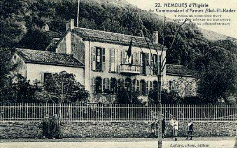
Emir'in Cezayir'de son gecesini geçirdiği ev

Duc d'Aumale de generalin sözlerine ve taahhütlerine sıkı sıkıya bağlı kalacağına dair kefil oldu. Emir daha sonra Fransız kampına yeni katılan Deira'sına çekilmek üzere izin istedi.