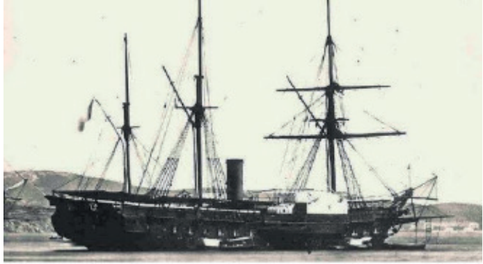
Le Labrador Buharlı Gemisi

Nihayet, güzergâhının Toulon'a doğru değiştirilmesinin üzerinden beş yıldan bir hafta az bir süre geçtikten sonra, 21 Aralık 1852'de, Emir Doğu'ya yöneldi. Maiyetiyle birlikte, İmparatorun kendisine tahsis ettiği Le Labrador buharlı gemisine bindi.