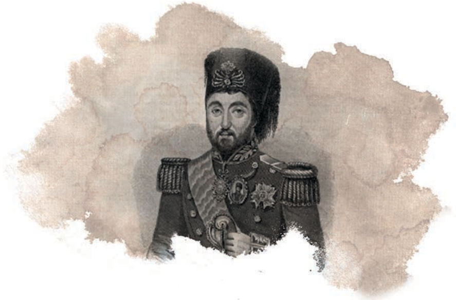
Mustafa Reşid Paşa

Emir'in İstanbul'daki üçüncü ziyareti, devletin ikinci resmi şahsiyeti olan Şeyhül-İslam Arif Hikmet Bey'e (1201-1275 H./1785-1859) tahsis edildi. Şeyhül-İslam, Osmanlı İmparatorluğu'nda Başbakan ile aynı seviyeye sahipti; Sultan'ın ayakta kabul ettiği tek kişiydi. Arif Hikmet'in uzun bir devlet adamlığı geçmişi vardır. II. Mahmud tarafından 1231'de Kudüs, 1236'da Mısır, 1239'da Medine kadılığına; 1242'de (1826) Şeyhül-İslamlığa, 1243'ten 1250'ye kadar devlet düzeyinde en önemli üçüncü makam olan Nakibül-Eşraflığa tayin edildi. Şeyhülislam olmadan önce Kazaskerlik görevinde bulundu. Toplantılar çok sayıda bakan ve üst düzey yetkilinin katılımıyla gerçekleşirdi. İmparatorluk müftüsü rolünün yanı sıra, büyük kadıları da o tayin ediyordu. Büyük bir edebiyatçı, şair ve İslam hukuku uzmanıydı. Medine'de on bine yakın yazmanın bulunduğu bir kütüphane kurmuştu. H. 1262'de (1846)'de tayin edildiği Şeyhülislamlık görevini 1854'e kadar sürdürmüştür.