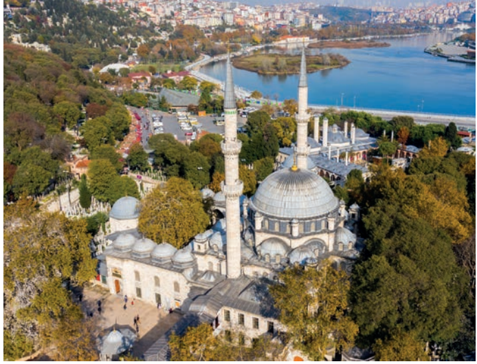
Eyüp Sultan Camii

Emir dönüşte Ayasofya Camii'ni ziyaret edip namaz kıldı. Bu, ilk olarak 4. yüzyılda inşa edilmiş bir bazilikayı ve Konstantinopolis'in 15. yüzyılda Müslümanlar tarafından fethedilmesiyle camiye dönüştürülmüştü.